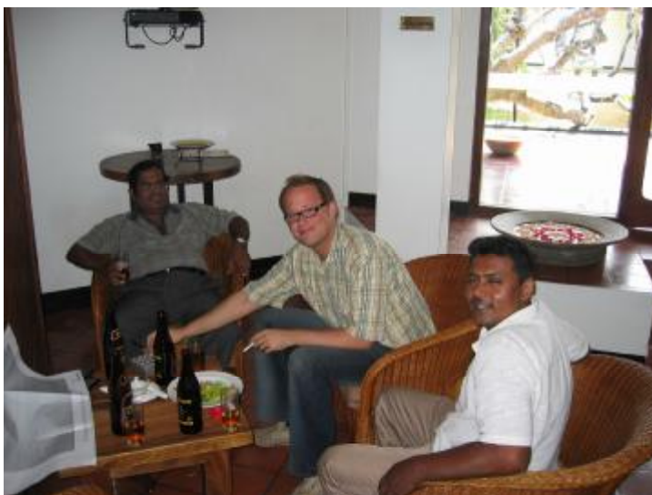
„Have a beer, make some chitchat“

Dabei war es selbstverständlich, dass die Unternehmen uns Fahrten organisieren wollten, uns (in einem Fall) zum Dinner ins Privathaus einladen oder krampfhaftes Socializing versuchten (we meet – have a beer – make some chitchat – have a good