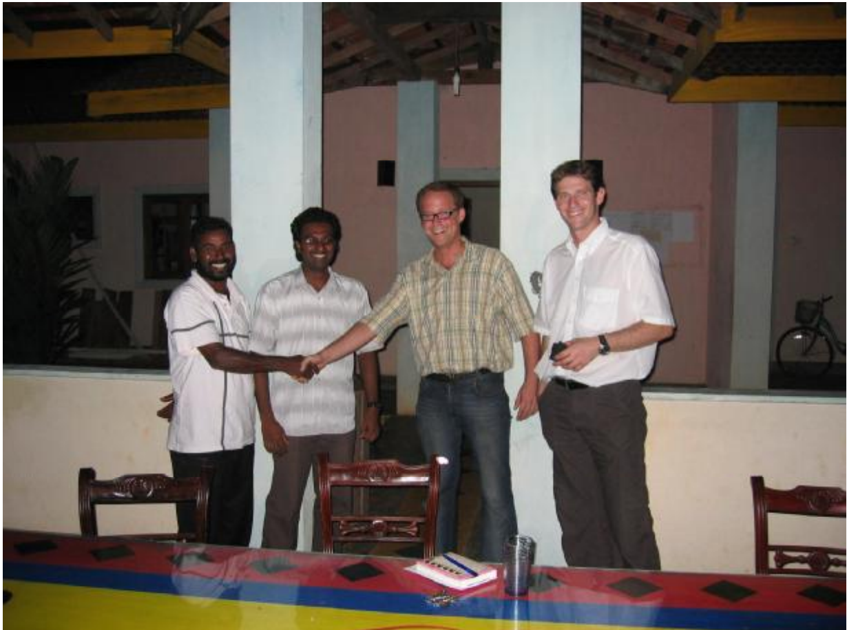
Man ist sich einig

Abschließend konnten wir noch einige Anreize zur Beschleunigung in den Vertrag verhandeln, d.h. eine Incentivierung von 3000 Rupies pro Tag für eine Fertigstellung vor dem 01.08. und einen Terminplan, der uns bei Nicht-Einhaltung von Fristen die Kündigung zusichert. Zudem haben wir dem Bauleiter bei erfolgreicher Abwicklung eine Reise nach Deutschland versprochen.