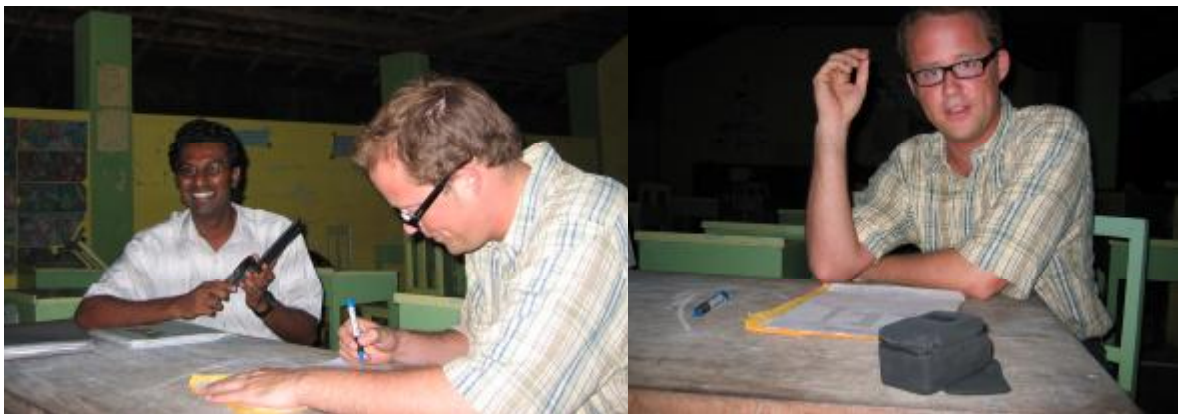
Es wird gearbeitet

Jeden Tag trafen wir uns wahlweise in der Schule oder im Hotel, um mit den fünf verbleibenden Unternehmen die einzelnen Positionen durchzusprechen und sie zur Abgabe neuer Angebote aufzufordern.