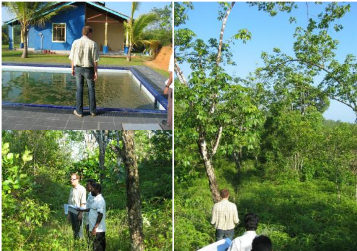
Eine erste Begehung der Anlage: Das Schwimmbad ist derzeit noch Biotop, das Grundstück ein Urwald

Schnell wurde klar, dass das eigentliche Sri Lanka nichts mit dem touristischen Sri Lanka zu tun hat, und die Hilfe in Form des Schulprojekts an der richtigen Stelle investiert ist.